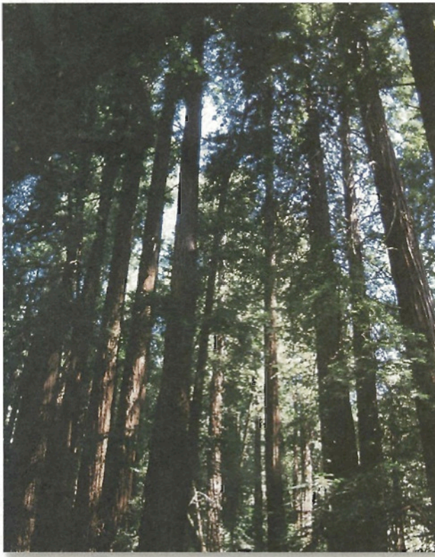
California redwoods grow in Muir Woods. The woods were named for John Muir.